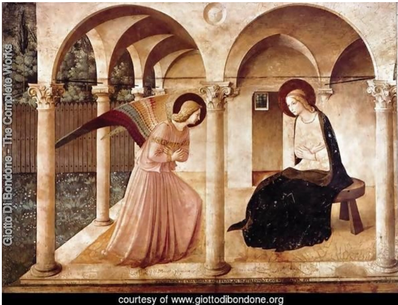
Giotto di Bondone: Zvěstování

Hle, přichází k tobě tvůj král, spravedlivý a zachránce. Zachariáš 9,9b